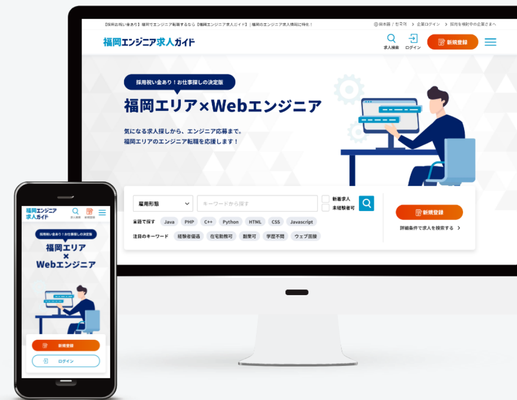
福岡エンジニア求人ガイド