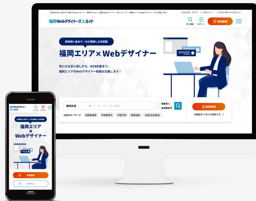
福岡Webデザイナー求人ガイド